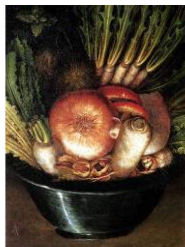
Arcimboldo – Le Jardinier

Samedi 26 juillet - Marais du Vigueirat Vendredi 25 juillet - Village de Mas Thibert Arles