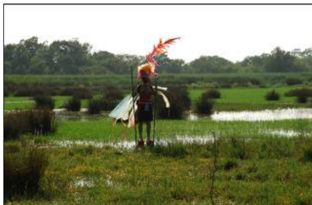
© Aliette Cosset – ilotopie/ Les Oiseaux Volent parce qu'ils Ouvrent les Bras

Les équipes de gestion du site ont pour but, outre la gestion des espaces naturels protégés des marais, de faire de l'éducation à l'environnement. Dans le cadre d'un écotourisme grandissant, il participe au programme européen LIFE PROMESSE, qui a pour objectif de réduire l'impact des activités touristiques sur l'environnement. Son action porte sur l'eau, les déchets, l'organisme, et les transports.