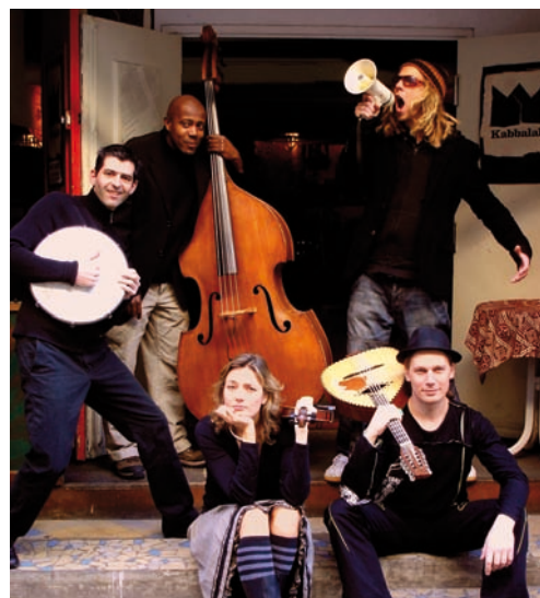
PREMIER ALBUM : Shlomo.