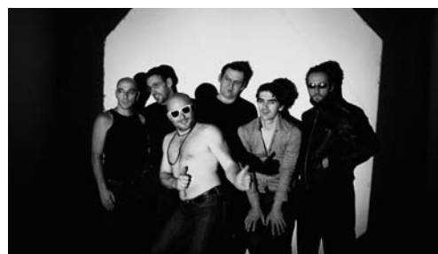
ALBUM : Rigolus.