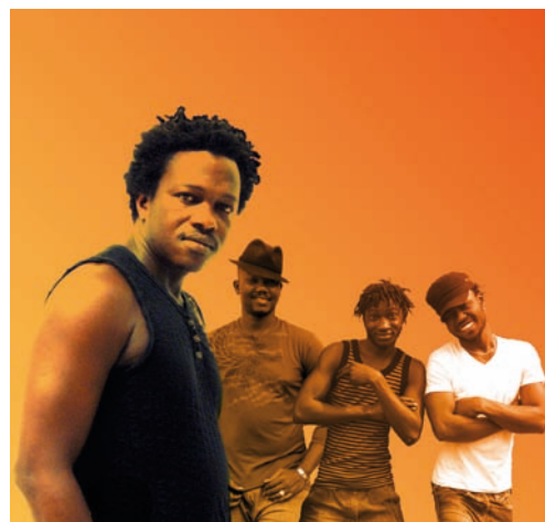
NOUVEL ALBUM : Seno.