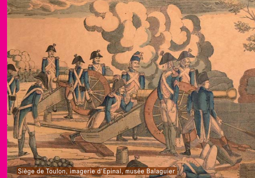
Siège de Toulon, imagerie d'Epinal, musée Balaguier

Le programme des animations de la Marine nationale pour les journées européenne du patrimoine 2010 est consultable sur www.la-seyne.fr