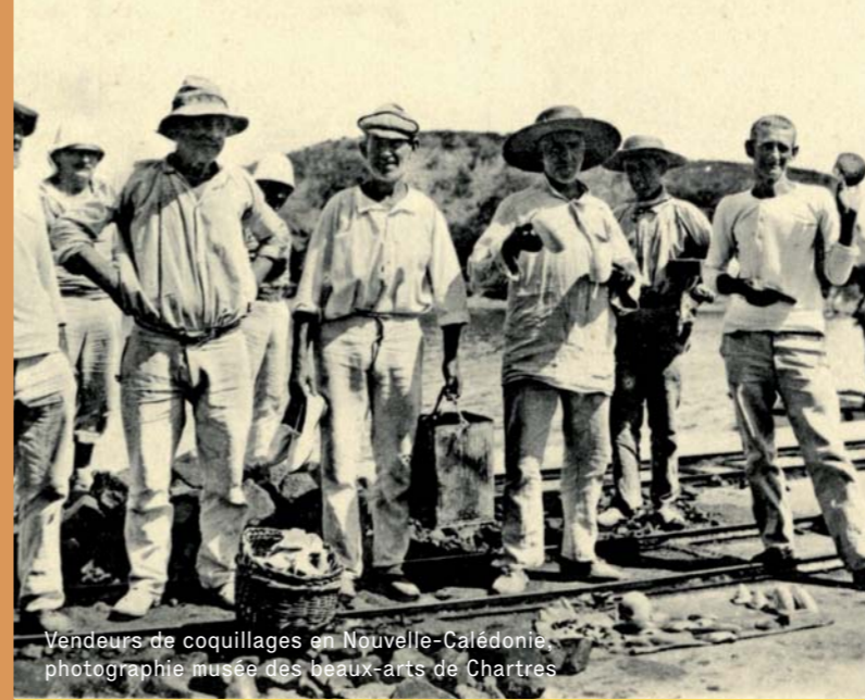
Vendeurs de coquillages en Nouvelle-Calédonie