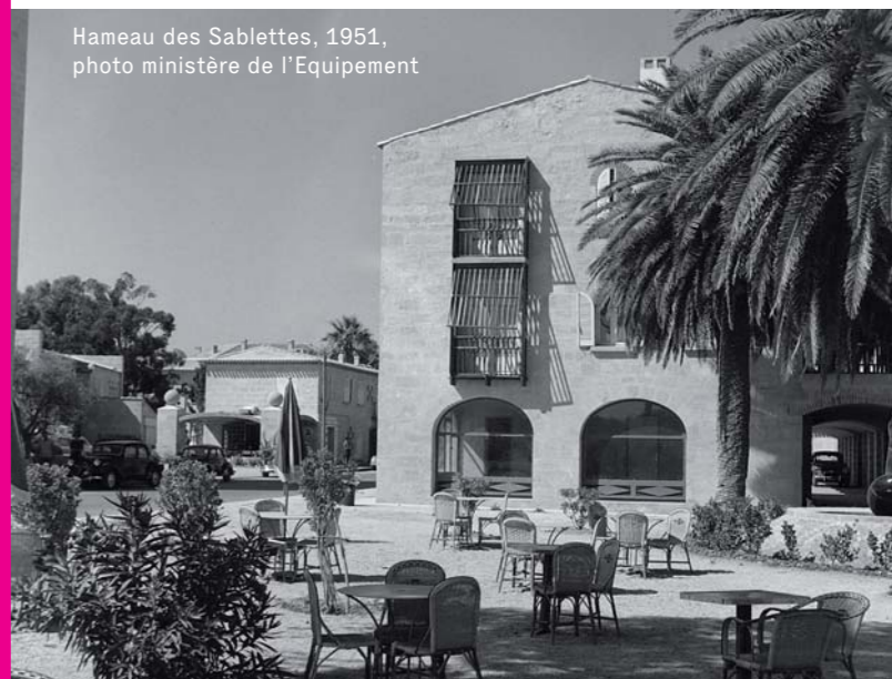
Hameau des Sablettes, 1951

Rendez-vous : Parking bas du Fort Napoléon.